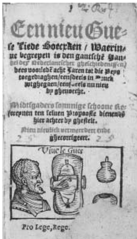
De oude versie van het Geuzenliedboek uit ongeveer 1576 (Göttingen NSUB).

nale hymne ter wereld is, is het dus pas een jaar of zeventig als zodanig in gebruik.